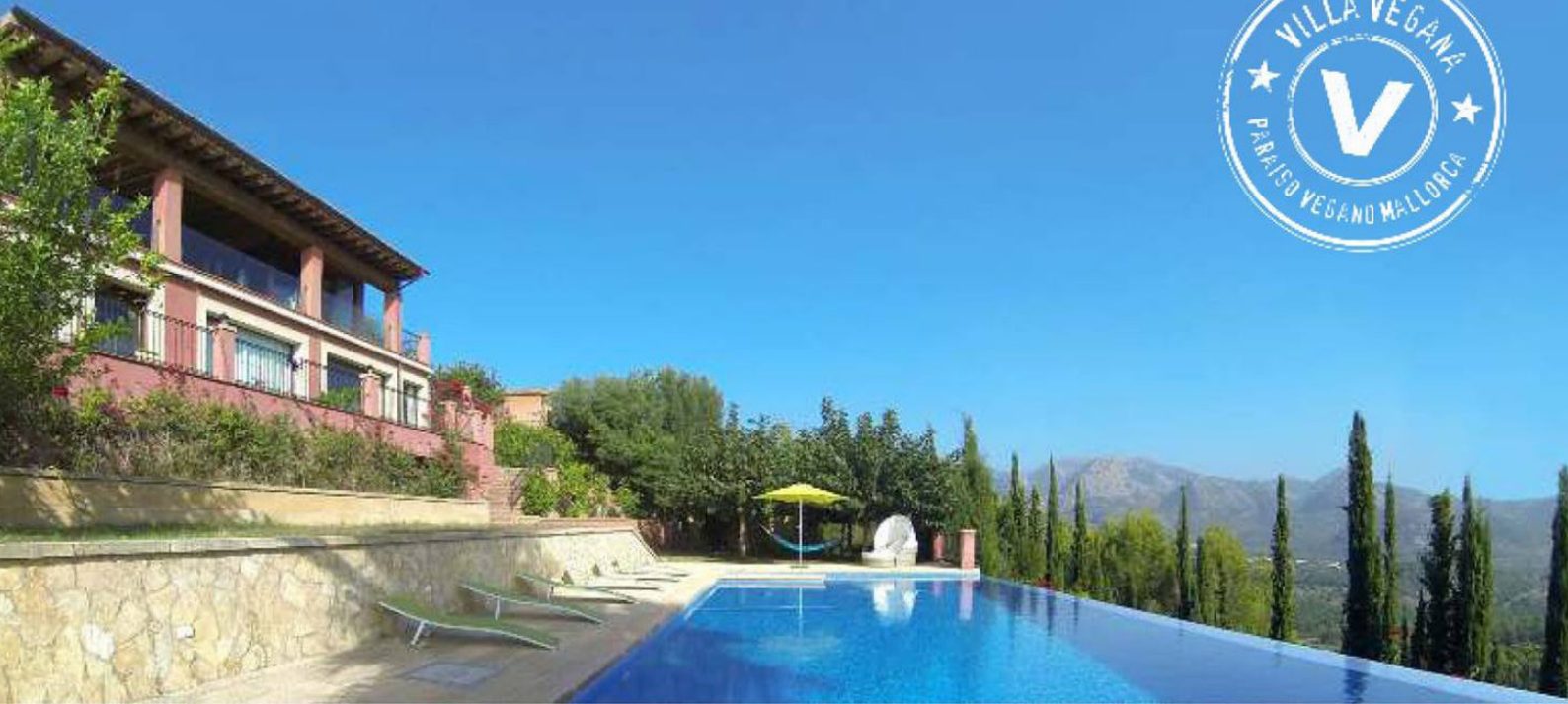
Die Villa Vegana auf Mallorca bietet Erholung und leckeres Essen in traumhafter Umgebung.

offen ist. Dazu kamen Zeitschriften und Blogs, die über uns berichteten. Bekannte Köche aus Deutschland und schlussendlich auch all unsere Gäste, die bei uns waren, machten fleissig Werbung. All diese Umstände, Zufälle, Ereignisse haben die Villa Vegana zu einem Paradies für Veganer auf Mallorca gemacht.